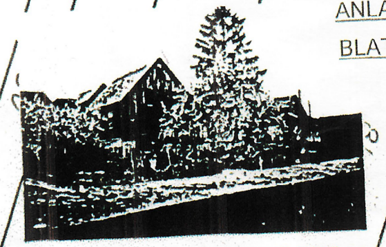
1 ERHALTENSWERTER ORTSRAND MIT AUSGEPRÄGTER DÖRFLICHER STRUKTUR - SCHEINEN, NUTZGÄRTEN, OBSTÄUMLÄNDE, SANDSTEINMAUERN