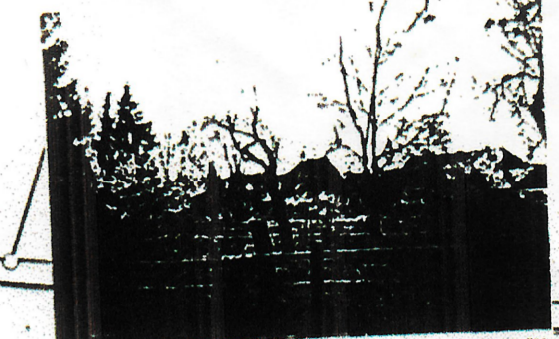
2 FLÄCHEN MIT AUSGEPRÄGTEM DÖRFERTYPISCHEN ORTSRANDSTRUKTUREN - NUTZGÄRTEN, GRABENLAND, OBSTGÄRTEN IN KLEINTEILIGER VIELFALT