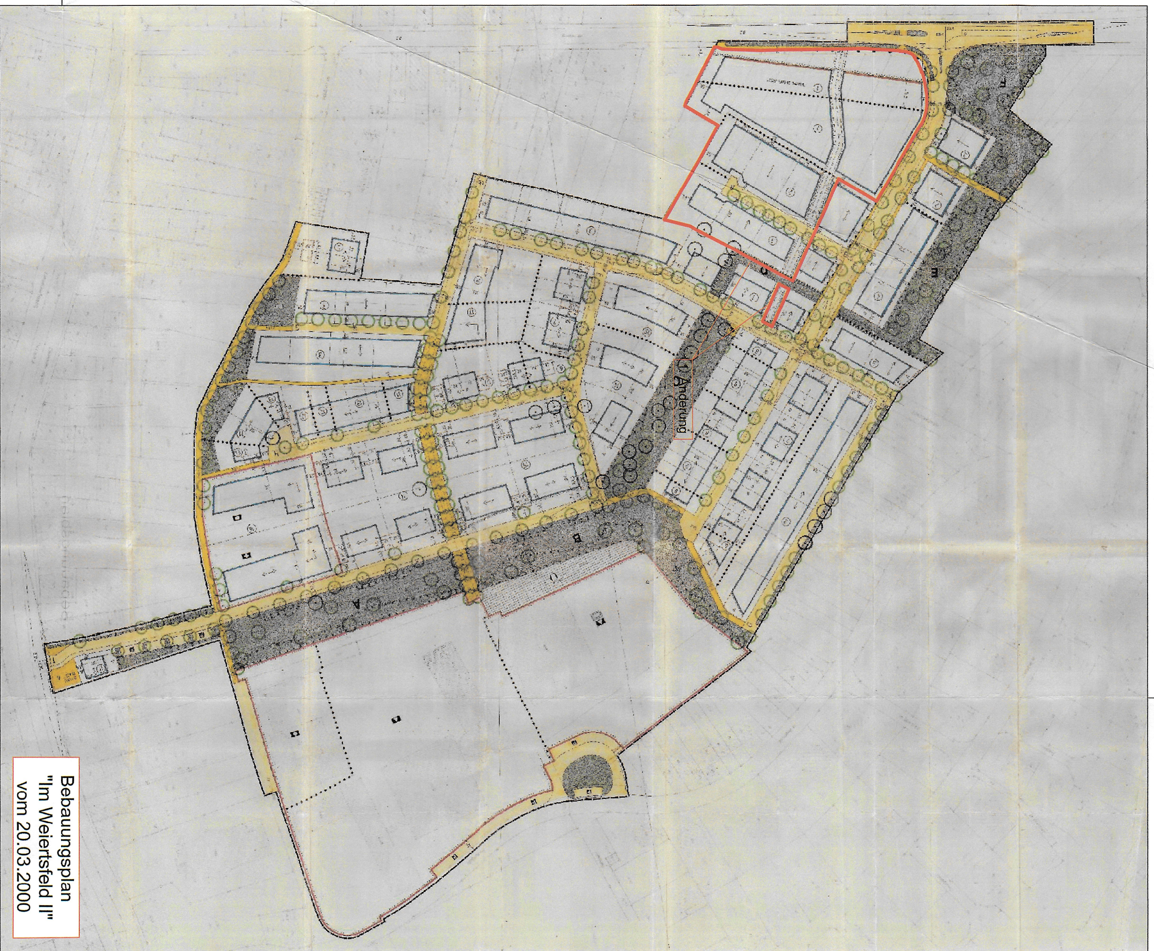
Bebauungsplan "Im Weierfeld II" vom 20.03.2000