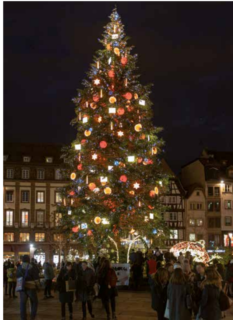
„Weihnachtliches Straßburg“ in Kehl-Straßburg

Die Imkerin und Fachfrau Simone Waidele erklärt den Aufbau, die Arbeiten und die Produkte eines Bienenvolkes. Sie dürfen bei einer Honigdegustation in das Reich der Naturaromen einschweben. Zum Abschluss genießen wir noch das Powerpaket Honig auf Brot. Je nach Wetterlage kann von Mai bis September noch ein Bienenstock besucht werden.