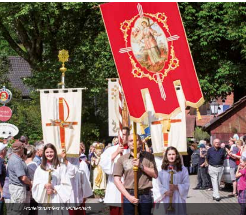
Fronleichnamfest in Mühlenbach

Am Fronleichnamfest in Mühlenbach ist einer der längsten und eindrucksvollsten Blumenteppe Deutschlands zu bewundern. Nach dem Gottesdienst um 9 Uhr wird die festliche Prozession von den Klängen der Trachtenkapelle begleitet. Möglichkeiten zur kulinarischen Stärkung bieten kleine Stände oder man kehrt in das gemütliche Gasthaus „Zum Ochsen“ ein, um die verschiedenen Köstlichkeiten des Küchenchefs zu genießen. Anschließend Prozession durch den Ort.