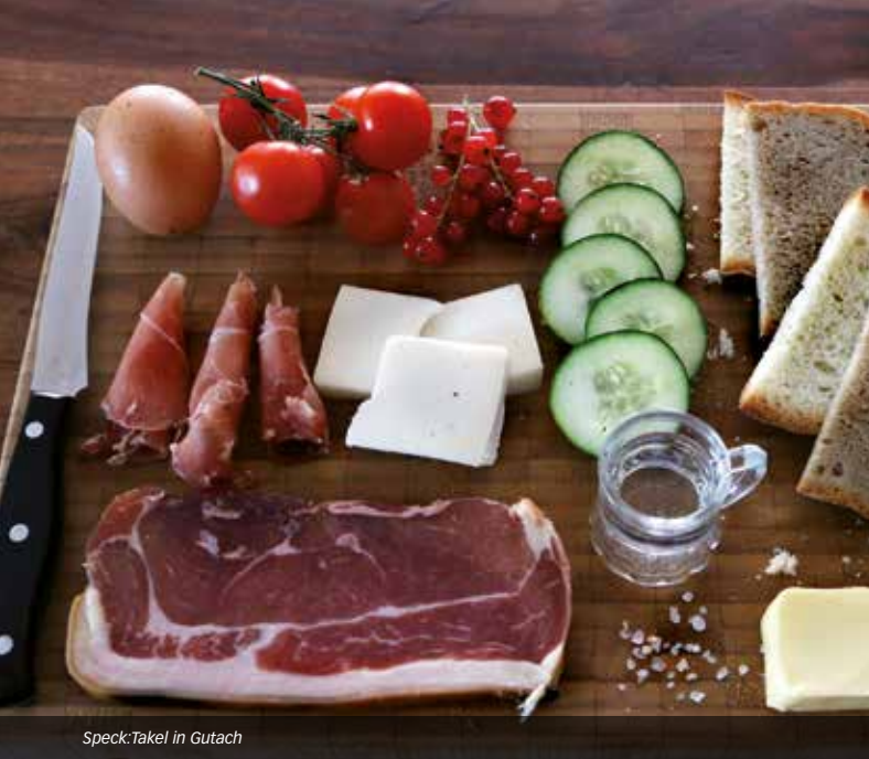
Speck: Takel in Gutach