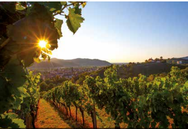
Offene Weinprobe mit Kellerführung in Gengenbach

Tourist-Information Bühlertal, am Infostern, Hauptstr. 92, 77830 // 14,00 €, Kinder bis 14 Jahre sind frei // Voranmeldung bei der Tourist Info Bühlertal unter Tel. 07223 7101180 // Tourist-Information Bühlertal in Kooperation mit den Naturpark Schwarzwald Mitte/Nord // Baden-Badener Weinhaus am Mauerberg Mit dem Förderverein Engelsberg geht es durch den historischen Weinberg. Hier erfahren Sie Spannendes über die Geschichte des Weinbaus. Lassen Sie den Abend bei der Engelsberghütte mit Neuem Wein des Baden-Badener Weinhauses am Mauerberg, Zwiebelkuchen und, falls sie bereits fallen, heißen Kastanien, ausklingen. Treffpunkt bei der Tourist-Info.