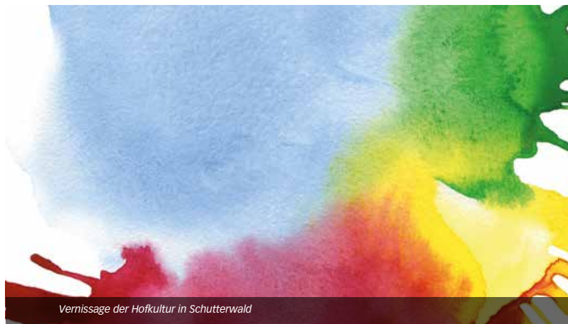
Vernissage der Hofkultur in Schutterwald

Weinhaus Renner, Bachanlage 2, 77704 Oberkirch // 53,00 € // Anmeldung erforderlich bei der Renchtal Tourismus GmbH, info@renchtal-tourismus.de, Tel. 07802 82600, www.renchtal-tourismus.de; max. 30 Teilnehmer // Renchtal Tourismus GmbH Entlang der 7 km langen Wanderstrecke über die Burgruine Schauenburg erhalten die Weinwanderer ein 5-Gänge-Menü mit korrespondierenden Weinen. Wandern Sie von der „Höll ins Paradies“ und genießen Sie bei kulinarischen Köstlichkeiten aus Küche und Keller die vielen wunderschönen Ausblicke in die idyllische Reblandschaft von Oberkirch. Die Weinwanderung ist von Donnerstag – Sonntag buchbar (außer an Feiertagen). Bitte rechtzeitig im Voraus bei der Renchtal Tourismus GmbH reservieren. Die Strecke ist separat ausgeschildert. Die Teilnehmer wandern auf eigene Faust. Wein-Guide auf Wunsch möglich.