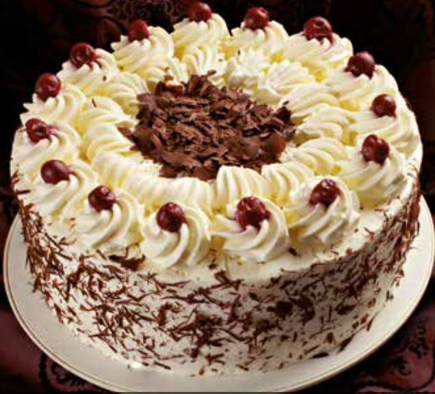
Schwarzwälder Kirschtorten - Backvorführung in Bad Peterstal-Griesbach