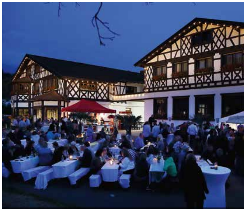
Wein-Feier-Abend in Sasbachwalden

Gasthof „Zum Kreuz“, Hauptstraße 66, 77794 Lautenbach // 45,00 € // Anmeldung erforderlich bei der Renchtal Tourismus GmbH, info@renchtal-tourismus.de, Tel. 07802 82600, www.renchtal-tourismus.de; max. 30 Teilnehmer // Renchtal Tourismus GmbH Mit einer Tour durch das Wanderparadies Lautenbach können Sie den neuen Hexensteig mit Hexenhäuschen erkunden. Entlang der 15 km langen Wanderstrecke genießen Sie an 4 Stationen ein typisches Schwarzwälder Vesper mit süßem Finale inklusive Getränke. Die Vesperwanderung ist von Donnerstag – Sonntag buchbar (außer an Feiertagen). Bitte rechtzeitig im Voraus bei der Renchtal Tourismus GmbH reservieren. Die Strecke ist separat ausgeschildert. Die Teilnehmer wandern auf eigene Faust. Wanderführer auf Wunsch möglich.