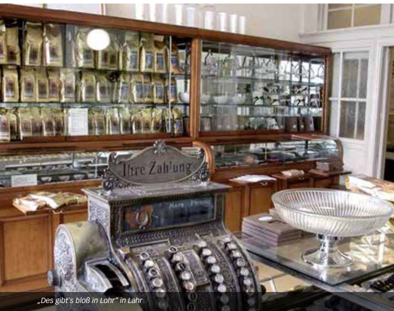
„Des gibt's bloß in Lohr“ in Lahr

Buswendeschleife in der Grimmerswaldstraße zur Wanderung. (Hausadresse Vollmer's Mühle: Hilsenhof 1, 77889 Seebach) // 21,50 € inkl. Programm und Verpflegung, Kinder bis 5 Jahre frei, 6 – 12 Jahre 11,00 € // Voranmeldung bis 14.05.2019 bei der Tourist-Information Seebach, Tel. 07842 948320. Max. Teilnehmerzahl von 60 Teilnehmer // Heimat- und Verkehrsverein Seebach e.V. Gemütlicher Brauchtumsabend in urgemütlicher Mühlenstube mit Buttern, Kienspanschnitten & Spinnen. Laternengang am Heimweg. Genießen Sie ein Vesper mit versch. Hausmacher Wurst, Schinken, Rahmkäse, selbstgestampfter Butter & Brot, Apfelmost, Apfelsaft, Mineralwasser & einem Schnaps. Wer nicht gut zu Fuß ist kann auch mit dem PKW bis direkt zur Mühle anfahren.