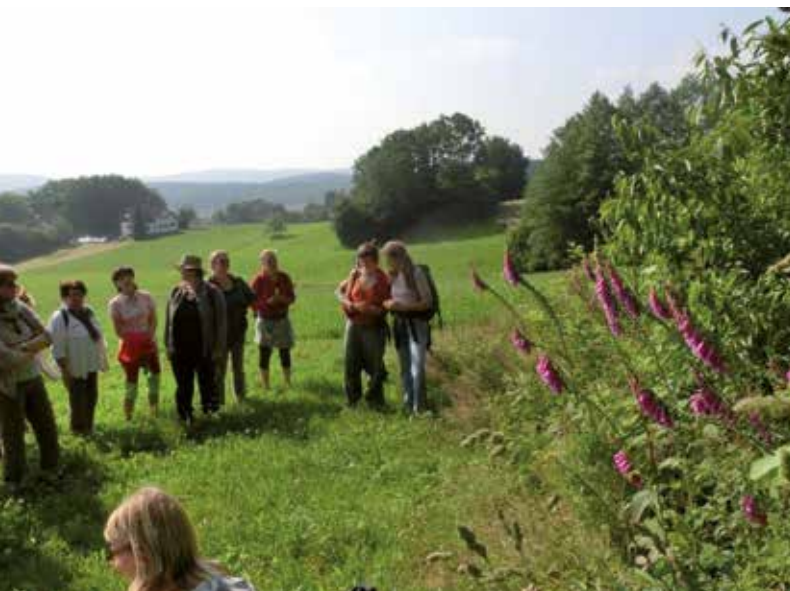
Wildkräuterführung in Lahr