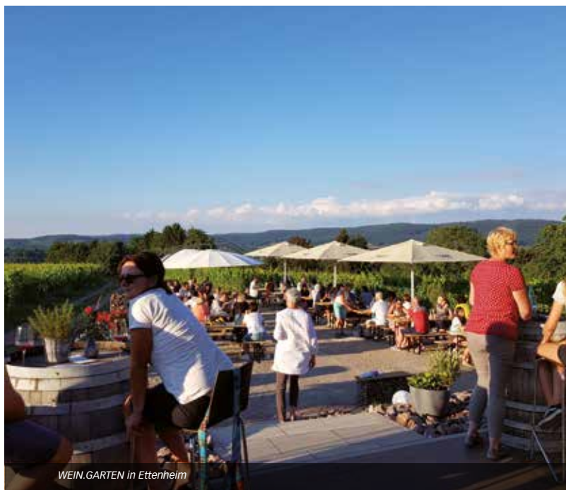
WEIN.GARTEN in Ettenheim

Entlang der 7 km langen Wanderstrecke über die Burgruine Schauenburg erhalten die Weinwanderer ein 5-Gänge-Menü mit korrespondierenden Weinen. Wandern Sie von der „Höll ins Paradies“ und genießen Sie bei kulinarischen Köstlichkeiten aus Küche und Keller die vielen wunderschönen Ausblicke in die idyllische Reblandschaft von Oberkirch. Die Weinwanderung ist von Donnerstag – Sonntag buchbar (außer an Feiertagen). Bitte rechtzeitig im Voraus bei der Renchtal Tourismus GmbH reservieren. Die Strecke ist separat ausgeschildert. Die Teilnehmer wandern auf eigene Faust. Wein-Guide auf Wunsch möglich.