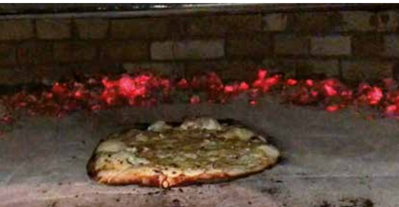
Flammkuchen „satt“ in Oberharmersbach

Genießen Sie unsere frisch gegrillten Forellen mit Salat und selbst gebackenem Brot in der urigen Grillhütte. Zum Abschluss geht's in die Hausbrennerei zur Brennereibesichtigung und Schnapsprobe.