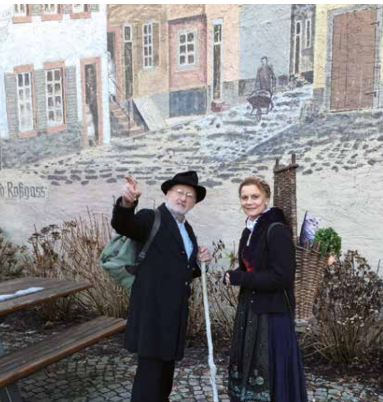
Sprücheklopper-Tour in Zell a.H.

Bäume und Pflanzen können uns viele Geschichten erzählen. Erleben Sie auf unserem Rundweg altüberliefertes Heilwissen gespickt mit mystischem Aberglauben. Im Anschluss an die Wanderung wird eine Kräutersuppe zur Stärkung gereicht.