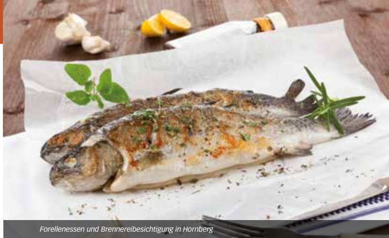
Forellenessen und Brennereibesichtigung in Hornberg

Entlang der 7 km langen Wanderstrecke über die Burgruine Schauenburg erhalten die Weinwanderer ein 5-Gänge-Menü mit korrespondierenden Weinen. Wandern Sie von der „Höll ins Paradies“ und genießen Sie bei kulinarischen Köstlichkeiten aus Küche und Keller die vielen wunderschönen Ausblicke in die idyllische Reblandschaft von Oberkirch. Die Weinwanderung ist von Donnerstag – Sonntag buchbar (außer an Feiertagen). Bitte rechtzeitig im Voraus bei der Renchtal Tourismus GmbH reservieren. Die Strecke ist separat ausgeschildert. Die Teilnehmer wandern auf eigene Faust. Wein-Guide auf Wunsch möglich.