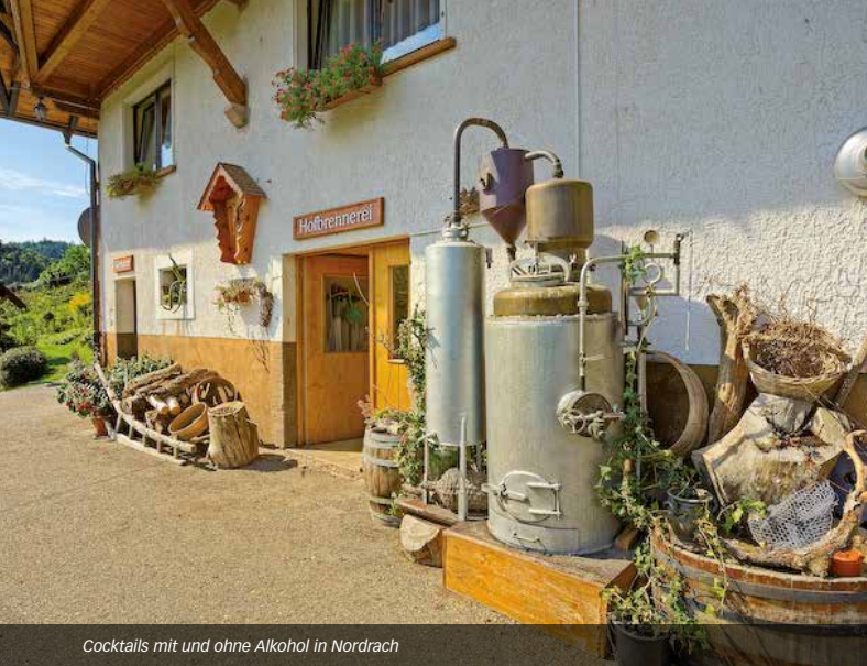
Cocktails mit und ohne Alkohol in Nordrach