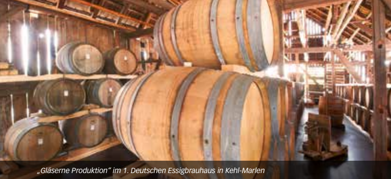
„Gläserne Produktion“ im 1. Deutschen Essigbrauhaus in Kehl-Marlen