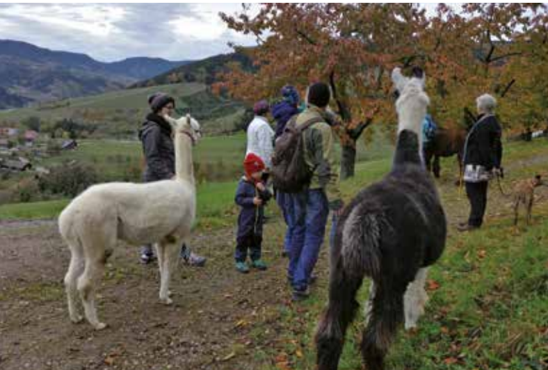
Alpaka-Trekking-Tour in Oberharmersbach

Als Phytothopterin und Anbauerin der Kräutermanufaktur Ottenheim, möchte ich Ihnen, jeweils passend zu einem Thema im Jahreslauf, heimische Teekräuter aus dem Bauerngarten vorstellen, woraus Sie ihre eigene Teekreation für zuhause zusammenstellen können. Es werden Tee's der Kräutermanufaktur und kleine Kräuterköstlichkeiten gereicht.