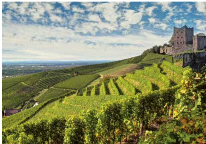
„Von der Höll ins Paradies“, Weinwanderung in Oberkirch