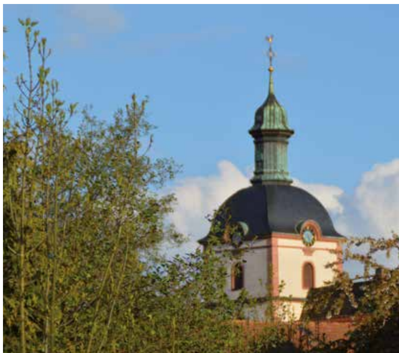
Auf geschichtlichen Pfaden in Sasbach

Amüsante Henkerstour durchs Hausacher Städtle mit anschließendem Henkersmahl in der Burgschänke. Gutes Schuhwerk, bei Dunkelheit Lampe.