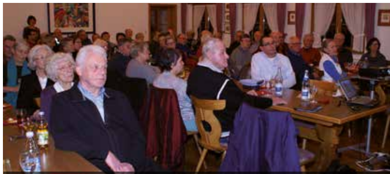
Geschichtliches aus vergangenen Tagen in Kappelrodeck-Waldulm

„Ondere Umständ“ - unterwägs mit de Hebamm´ Sophie durch Hasle“ Wer bringt die Kinder? Natürlich der Storch, der sich wieder in der alten Storchentstadt Haslach anzusiedeln scheint. Und wer hilft dem Storch dabei, dass die Kindle wirklich auf die Welt kommen? Natürlich die „Hebamm´ Sophie“, die durch Haslachs Altstadt mit einer ganz besonderen Thementour führt. Eine amüsante Altstadtführung mit anschließendem „Strammer -Max -Essen“.