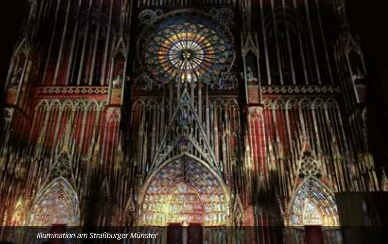
Illumination am Straßburger Münster