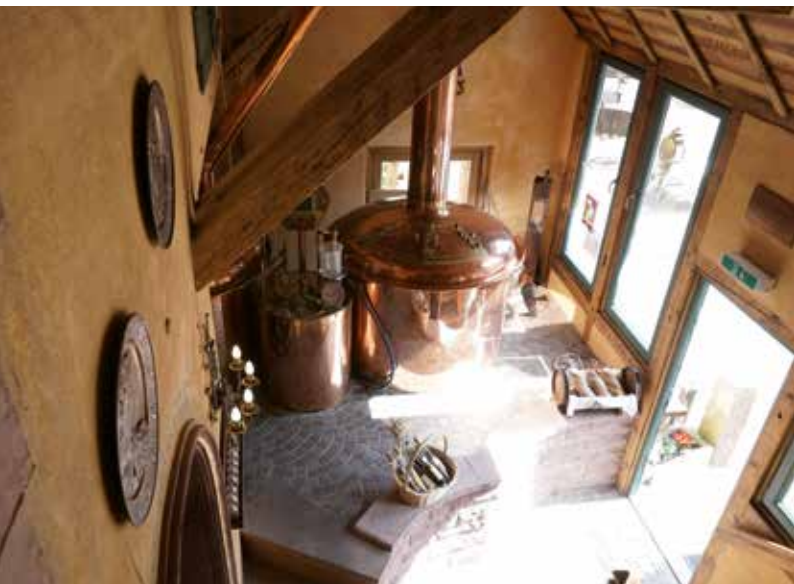
Brauhaustour in Lahr

Sie spazieren durch ein sich rasant entwickelndes, altes Marktstädtchen. Eine Erlebnis-tour mit wirtschaftswunderbaren Geschichten. Erfahren Sie, wo es "Blonde Engel" gab, die "Hautevolée" verkehrte ... und wo im Städtle der Bär schon damals steppte! Zum Abschluss werden Sie mit einem köstlichen "Hawaii Toast" verwöhnt