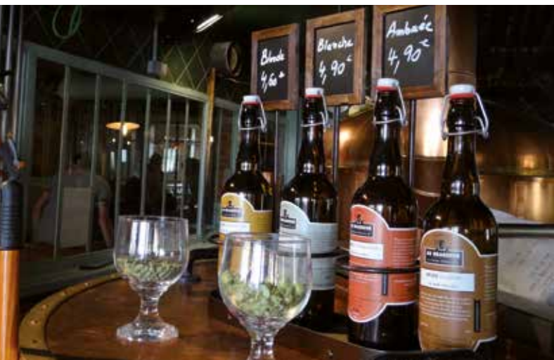
„Literatencafés und Künstlerkneipen“ in Kehl-Straßburg

Lassen Sie sich genussvoll verführen von der zarten Buttermakrele bis zum herzhaften Rollmops. Mit einem Farbenspiel der Weine erleben Sie interessante Räucherfisch-Wein-Kombinationen und erfahren Einiges zum Kulturgut WEIN. Das Feuerwerk der Genüsse wird mit einem außergewöhnlichen Dessert gekrönt.