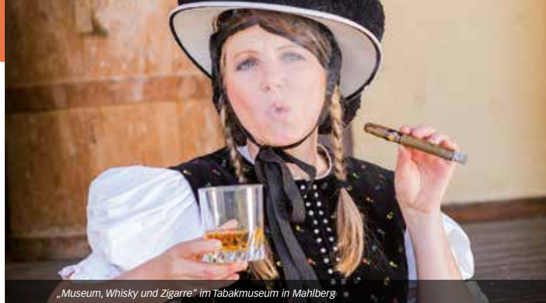
„Museum, Whisky und Zigarre“ im Tabakmuseum in Mahlberg

Cocktails mit Bränden /Likören aus eigener Brennerei. Gemixt mit Kräutern aus dem hofeigenen Garten. Ebenso alkoholfreie Cocktails mit fruchtigen Säften. Rezepte, Brennerei- und Kräutergartenführung inklusive.