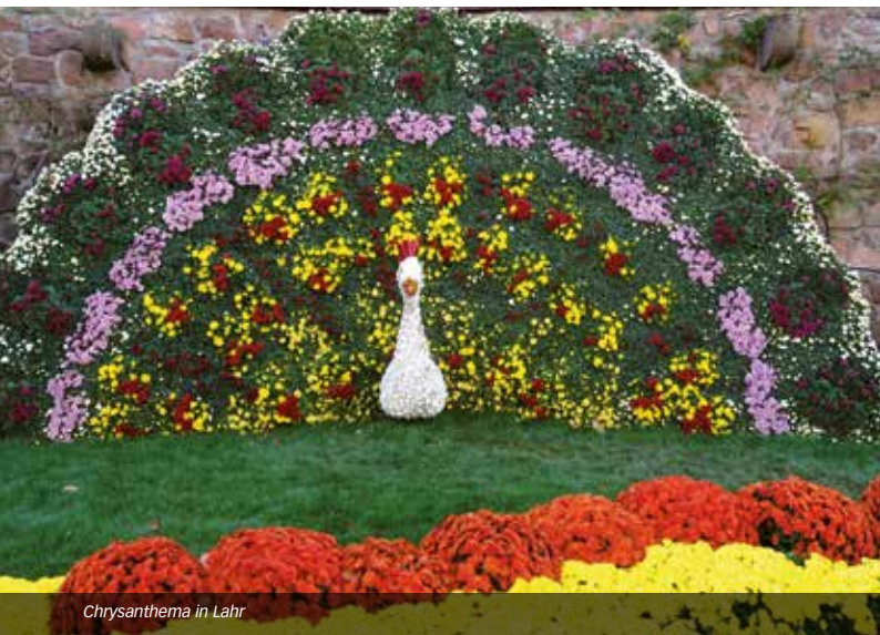
Chrysanthema in Lahr

Weinmanufaktur Gengenbach-Offenburg eG, Am Winzerkeller 2, 77723 Gengenbach bzw. Vinothek mit historischem Keller Zeller Abtsberg, Schulstr. 5, 77654 Offenburg // 6,00 € // Voranmeldung bis 1 Tag vor der Veranstaltung unter Tel. 07803 96580; max. 10 Teilnehmer // Weinmanufaktur Gengenbach eG Genießen Sie die prämierten Weine der Weinmanufaktur Gengenbach-Offenburg und wählen Sie den Ort einfach selbst. Verkostung und Kellerführung in Gengenbach sowie Zell-Weierbach (Zeller Abtsberg).