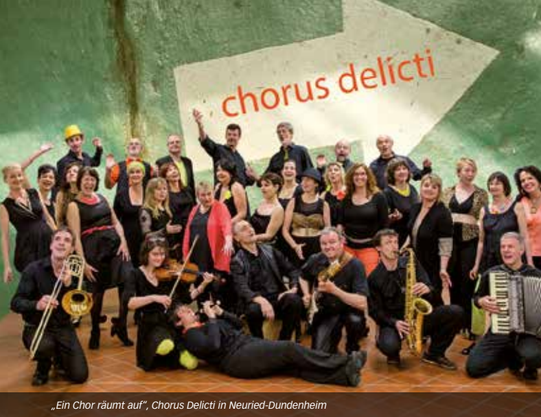
„Ein Chor räumt auf“, Chorus Delicti in Neuried-Dundenheim