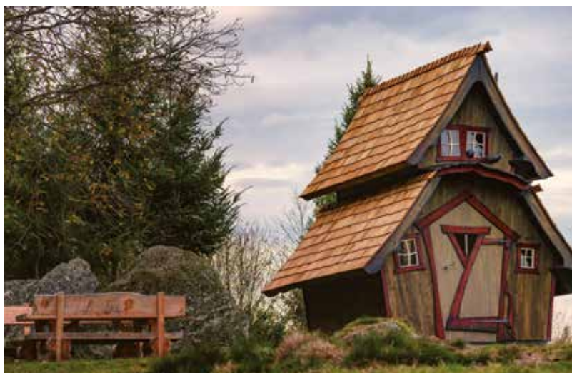
Vesperwanderung in Lautenbach

Mit einer Tour durch das Wanderparadies Lautenbach können Sie den neuen Hexenstein mit Hexenhäuschen erkunden. Entlang der 15 km langen Wanderstrecke genießen Sie an 4 Stationen ein typisches Schwarzwälder Vesper mit süßem Finale inklusive Getränke. Die Vesperwanderung ist von Donnerstag – Sonntag buchbar (außer an Feiertagen). Bitte rechtzeitig im Voraus bei der Renchtal Tourismus GmbH reservieren. Die Strecke ist separat ausgeschildert. Die Teilnehmer wandern auf eigene Faust. Wanderführer auf Wunsch möglich.