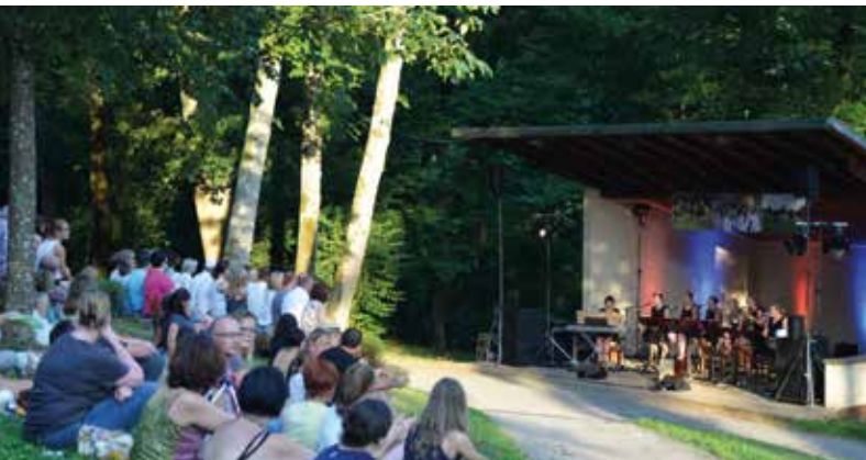
Nohocker-Party in Zell am Harmersbach

Nach einer interessanten Führung durch Deutschlands größtes Tabakmuseum bei dem Sie viel historisches, kurioses und alltägliches rund um den Tabak erfahren, erhält jeder Besucher einen original badischen Whisky und je nach Wunsch eine Zigarre oder ein Zigarillo dazu. Wer keinen Whisky mag erhält selbstverständlich auch ein Glas Wein oder Wasser.