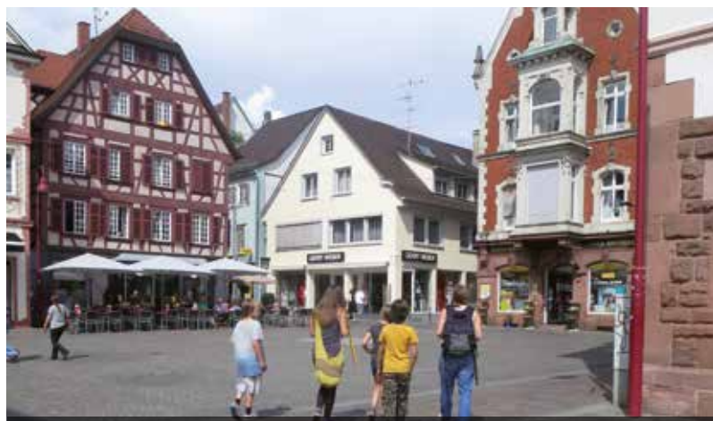
„Entdecke das Mittelalter“ Kinderführung in Lahr

Familie Huber, Engelberg 12, 77784 Oberharmersbach // 14,50 € (exkl. Getränke), Kinder bis 5 Jahre frei, Kinder von 6-14 Jahren 1,00 € je Lebensalter // Voranmeldung bis zum Veranstaltungstag um 12.00 Uhr (vorbehaltlich freien Plätzen) unter Tel. 07837 871 oder info@hasegallis-besenwirtschaft.de; max. 60 Teilnehmer // Familie Huber Genießen Sie frische und hausgemachte Flammkuchen in verschiedenen Variationen bis Sie satt sind. Scheinbar längst vergessene Volkslieder, wird unserer Akkordeonspieler für Sie spielen und Sie zum Mitsingen, Schunkeln oder einfach zum Zuhören einladen. Wir freuen uns, Sie auf unserer überdachten Terrasse mit herrlichem Panoramablick begrüßen zu dürfen. Weitere Infos und weitere Veranstaltungen finden Sie auf unserer Homepage. www.hasegallis-besenwirtschaft.de