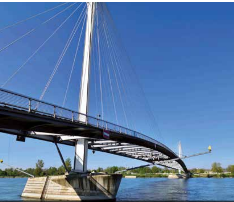
Genussradeln in Kehl

Gasthof „Zum Kreuz“, Hauptstraße 66, 77794 Lautenbach // 45,00 € // Anmeldung erforderlich bei der Renchtal Tourismus GmbH, info@renchtal-tourismus.de, Tel. 07802 82600, www.renchtal-tourismus.de; max. 30 Teilnehmer // Renchtal Tourismus GmbH Mit einer Tour durch das Wanderparadies Lautenbach können Sie den neuen Hexensteig mit Hexenhäuschen erkunden. Entlang der 15 km langen Wanderstrecke genießen Sie an 4 Stationen ein typisches Schwarzwälder Vesper mit süßem Finale inklusive Getränke. Die Vesperwanderung ist von Donnerstag – Sonntag buchbar (außer an Feiertagen). Bitte rechtzeitig im Voraus bei der Renchtal Tourismus GmbH reservieren. Die Strecke ist separat ausgeschildert. Die Teilnehmer wandern auf eigene Faust. Wanderführer auf Wunsch möglich.