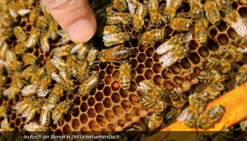
Im Reich der Bienen in Zell-Unterharmersbach